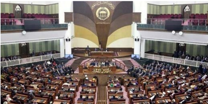
صفحه ۳ بود

مجلس تصمیم دارد کسانی را به کمیسیون مختلط معرفی کند که از رد فرمان حمایت کند و به همین دلیل ده نفر پیشنهاد شده در جلسه امروز (دیروز) مورد تایید قرار نگرفتند. وی افزود: فضای تقابل میان مجلس بزرگان و مجلس نمایندگان این طور نشان می دهد که به این زودی ها ما شاهد ایجاد کمیسیون مختلط نخواهیم بود