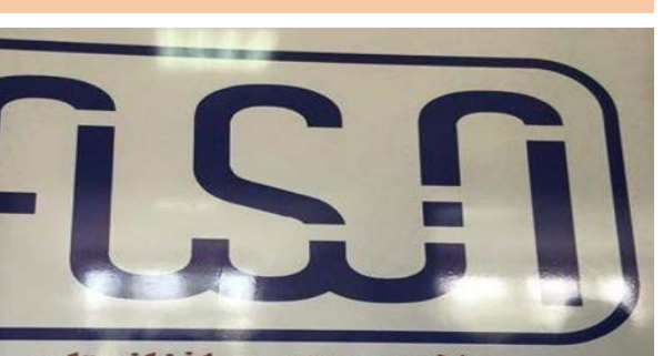
علامت استاندارد افغانستان معرف محصولات با کیفیت افغانی

پیش از این کالاهای افغانستان بدون استاندارد ملی به بازارهای جهانی صادر می‌شد. بازرگانان افغانستان در برخی از موردها شکایت داشتند که کشورهای همسایه کالاهای افغانستان را با استفاده از استاندارد ملی خودشان وارد بازارهای بین