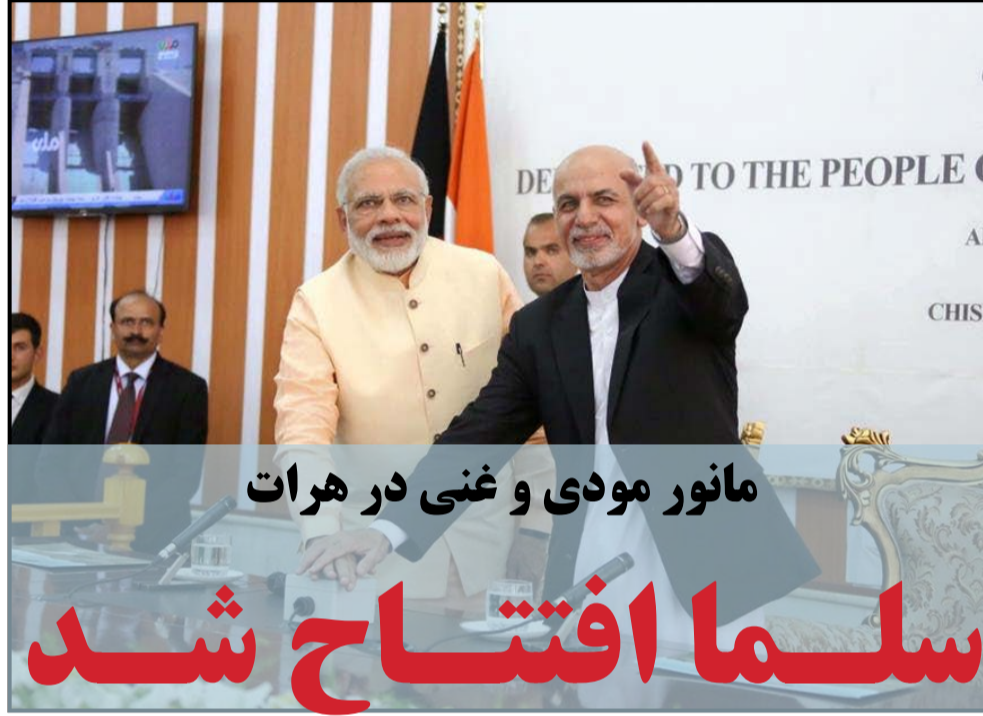
مانور مودی و غنی در هرات

عزیزی بانک ماشین های خود پرداز صرافی خویش را در افغانستان توسعه می دهد صفحه ۳