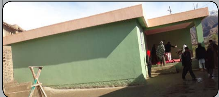
دکلیو دبیارغونې او پراختیا وزارت د ملي پیوستون پروگرام دعامه اړیکو دفتر

«مخکې به که په کلی کې کومه شخړه رامینځته کیده، د شخړې د له مینځه وړلو او دغونډو د پرانستلو له پاره ځانگړې ځای نه و. په جوماتونو کې هم د دغه رازغونډو جوړیدل مناسب نه دي، همدارنگه که دواړه اوخیرات په مراسمو کې به خلکو خیمې کړا کولې، البته نوموړي خیمې به څو ځلې د باد په وسیله راغورځیدلې او لدې چې تیر شو په دیگي کې به خاورې او ډورې لویدلې او کله به هم د واورې او باران د وړیدو له امله خلکو نشو کولې خپل دغم او خوښی مراسم په ښه توگه پرانیزې، خو اوس مونږ د کلیو د بیارغونې او پراختیا وزارت د ملي پیوستون پروگرام په مرسته او همکارۍ وتوانیدو دوه تولنیزمرکزونه چې یو یې د نارینه و د ستونزو د حلولو او بل یې هم د ښځو دغونډو د پرانستلو له پاره جوړ کړوکه دوداه او یا هم خوږې کوم مراسم وې، ښځینه مراسم په ښځینه تولنیز مرکز او د نارینه وو مراسم په نارینه و تولنیز مرکز کې لمانځل کېږي چې الحمد لله اوس د دې کلی د خلکو ستونزې لدې پلوه له منځه تللي دي»