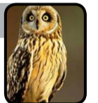
سخی داد هاتف

قانون اساسی ۱۳۴۳ ساختار سنتی قدرت (تمرکز یک‌جانبه و مطلق قدرت در خاندان شاهی) را به شکل نرم برهم زد و اعضای خانواده، به استثنای شاه، از قدرت بیرون رانده شدند. این تحول نقطه عطف برای مدرن‌سازی نظام سیاسی افغانستان بود. اما کودتای ۱۳۵۲ ساختار جدید تقسیم قدرت را از میان برد و خود نتوانست روش پایدار تقسیم یا گردش قدرت را به‌وجود آورد. فارغ از عوامل خارجی، کشمکش‌های چهار دهه اخیر، پس‌لرزه‌های همان ساختار شکنی است که در ۱۳۵۲ انجام شد. نخبه‌گان سیاسی تا هنوز نتوانسته‌اند روش پایدار برای تقسیم قدرت به‌وجود آورند.