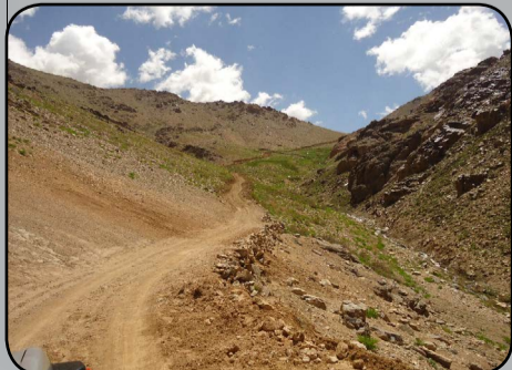
دکلیو دبيارغونې او پراختيا وزارت دملي پيوستون پروگرام دعامه اړيکو دفتر

«مخکې لدې چې زمونږ په کلی کې سرک نه وو، زمونږ اکثره کرنيزمحصولات بازار ته په ټاکلې موډې د نه رسيدو له امله خوسا کيدل . زمونږ دکلي اکثره حاصلات انگوراو آلوگان دي چې ليردول يې تر بازاره پورې د پراختيا غواړي چې مونږ د همدې سرک د نه شتون له امله له اقتصادي پلوو د پرېمانمن کيدو، خو اوس د سرک په درلودو سره کولای شو په ډيرې هوساينې سره خپله ميوه د موټر په وسيله بازار ته خرڅلاو له پاره وليږدوو . سرکال د همدې سرک له برکته وتوانيدو د مخکينيوکلونو په پرتله څوځلي خپل محصولات وپلورو او گټه ترلاسه کړو .»