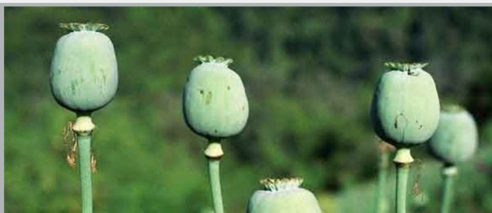
روسیه اعلام کرد: بی توجهی پیمان ناتو به دیدگاه‌های مسکو برای تقویت مبارزه با قاچاق مواد مخدر در افغانستان و تولید این مواد که منبع اصلی درآمد شبه نظامیان است، ادامه دارد.

گروشکو همچنین گفت: فعالیت طراحان بی‌مسئولیت ژئوپولیتیک در این منطقه که ناتو در آن حضور دارد به تخریب سازوکارهای سنتی اداره دولتی و تامین امنیت،