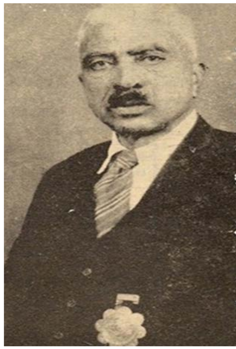
صبور الله سپاه سنگ