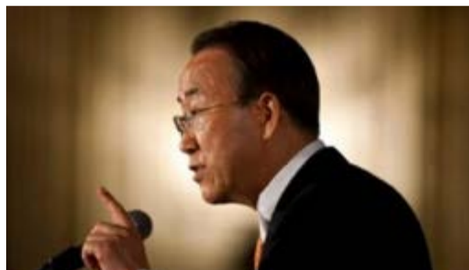
دبیرکل سازمان ملل در مصاحبه با چهار روزنامه اسپانیایی گفت که «ظالمانه» و «غیرقابل قبول است» که روند مذاکرات سیاسی پیرامون بحران سوریه «در

گرو «سرنوشت رئیس جمهوری این کشور باشد. بان کی مون، دبیرکل سازمان ملل در مصاحبه با روزنامه‌های ال پائیس، ال موندو، ای بی سی و لاونگاردیا گفت: طرف‌های دیپلماتیک اصلی ذی ربط در پرونده سوریه در وین به هیچ توافقی دست نیافتند که براساس آن تاکید شود آینده بشار اسد، رئیس جمهوری سوریه را باید مردم سوریه تعیین کنند. وی تصریح کرد: ظالمانه و غیرمنطقی است که تمامی روند مذاکرات سیاسی به سرنوشت یک شخص وابسته باشد. این مساله غیرقابل قبول است. وی در خصوص راه حل پیشنهادی مبنی بر تشکیل دولت انتقالی گفت که دولت سوریه معتقد است که باید بشار اسد بخشی از این دولت باشد اما کشورهای متعددی به ویژه غربی‌ها می‌گویند که اسد هیچ جایگاهی در این دولت نداشته باشد.