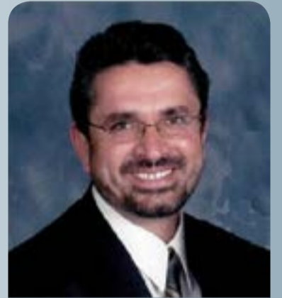
خواجه بشیر احمد انصاری

آنچه به نام نهضت اسلامی یاد می‌شود و به دست شخصیت‌هایی چون حسن‌البننا و مودودی بنیان‌گذاری گردید، دارای شاخه‌ها و پنجه‌های فراوانی بوده که برخی از این شاخه‌ها در آسیا و آفریقا همین حالا حکومت می‌کنند. آن شاخه‌هایی که وارد مرحله عملی تجربه حکومت‌داری شده‌اند، احساس می‌کنند که در زمینه فقه هویت و فقه تعامل با گروه‌های قومی نیازمند تیوری می‌باشند.