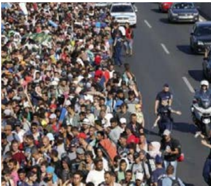
وی تاکید کرد: ما خواهان اسلامی شدن اروپا نیستیم. ما نمی‌خواهیم فرهنگ مسیحی غربیمان از بین برود.

رهبر حزب راست افراطی اتریش، امریکا و ائتلاف نظامی ناتو را متهم به ایجاد بحران پناهجویانی کرد که اروپا را درگیر ساخته است.