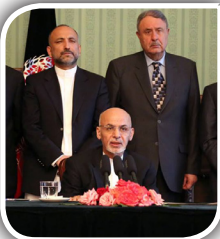
واکنش تند، رفتار ملایم