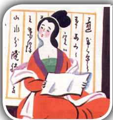
مقدمه‌ی بر اساطیر چینی

پیشنویس تعدیل قوانین انتخاباتی را آماده کردیم