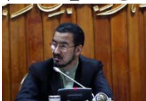
آنها شده است.

آگاهان امور نیز با مردم هم نظر بوده و می‌گویند که علت بی‌نظمی‌ها در ادارات دولتی و حتی نامنی‌های اخیر در کشور ادامه کار سرپرست وزیران است.