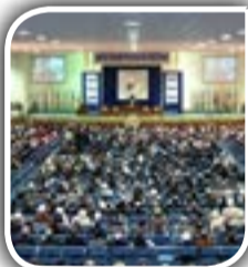
ده سال پس از قانون اساسی

طرح ایجاد اصلاحات در شهر و شهرداری کابل پاسخی مختصر به درخواست رییس‌جمهور دکتر محمد اشرف غنی