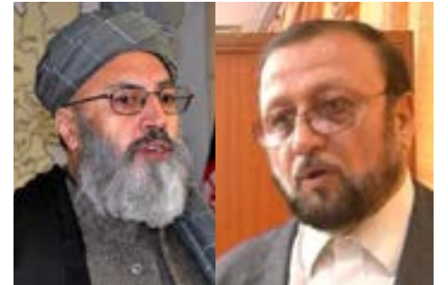
یکی از نزدیکان رییس‌جمهوری می‌گوید که پیشنهاد

شده است که وزارت‌خانه‌های کلیدی باید به رقابت آزاد گذاشته شود تا کسانی بیرون از هر دو تیم بتوانند در این رقابت شرکت کنند. اما نزدیکان رییس‌اجرایی حکومت می‌گویند، در موافقتنامه‌یی که میان دو طرف به امضا رسیده، روی تقسیم مساوی وزارت‌خانه‌های کلیدی تأکید شده است و از به رقابت گذاشتن این پست‌ها در این موافقت‌نامه چیزی گفته نشده است. براساس اظهارات یک منبع نزدیک به رییس‌جمهور غنی، دو طرف روی ۱۴ وزارت‌خانه‌یی که بسیار مهم