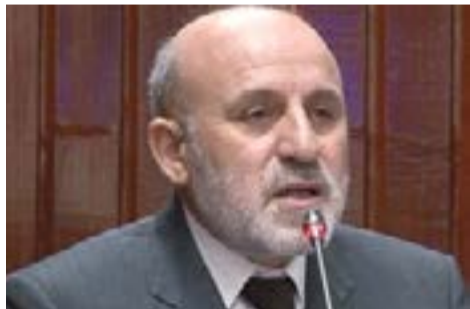
هفته‌های اخیر می‌تواند درخواست افغانستان را تحت الشعاع قرار دهد.

رییس جمهوری سابق افغانستان، از هند درخواست ۲۳۰ نوه تجهیزات نظامی، از جمله بالگرد و اسلحه کرده بود. همچنین کرزی یک فهرست از تجهیزات نظامی را در طول دو بازدید خود از هند در اواخر ماه دسمبر سال گذشته به دهلی نو تحویل داد. با این حال، هند عرضه سلاح‌های کشنده به ارتش افغانستان را به دلیل واکنش منفی پاکستان به این مسئله، رد کرده است. در این میان داوودزی گفته است دولت کابل انتظار دارد درخواست‌شان برای تأمین سلاح از هند اجرایی شود. رقابت دهلی نو و اسلام‌آباد در منطقه مورد مناقشه کشمیر؛ به ویژه در