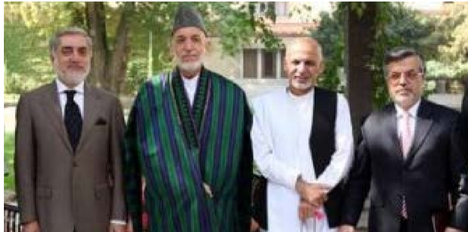
رییس جمهور مبنی تصفیة کابل بانک و اصلاحات در نهادهای عدلی و قضایی صورت گرفته است؛ اما هیچ اقدامی از سوی شخص رییس اجرایی که بیانگر اجرایی توافق سیاسی باشد، صورت نگرفته است.

استاد سیحون تأکید کرد، تنها چند اقدام از سوی