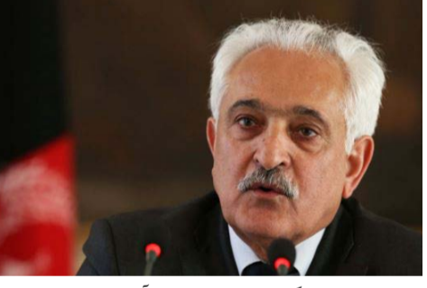
حالی صورت گرفت که نظامیان آن کشور عملیات گسترده ای را بر ضد مخالفین مسلح تندرو در وزیرستان شمالی... ادامه صفحه ۶

و می گوید که در این سفر، روی این مساله به گونه جدی با مقامات پاکستانی صحبت کرده است. آقای سپینتا گفت که موجودیت نظامیان پاکستانی علاوه بر جنگ هلمند در برخی مناطق دیگر کشور هم خیلی آشکار است. رئیس شورای امنیت ملی روز پنجشنبه هفته گذشته در رأس یک هیات بلند پایه به پاکستان سفر کرد و با مقامات پاکستانی ضمن بحث در ارتباط به حملات راکتی آن کشور بر ولایت کنر روی مسایل دیگر نیز گفت و گو کرده است. سفر رئیس شورای امنیت ملی به پاکستان در