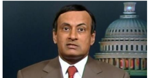
سفیر سابق پاکستان در امریکا در کتابش فاش کرد که اسلام آباد گاهی اوقات

از واشنگتن خواسته بود تا با استفاده از حملات پهپادهایش، رهبران تحریک طالبان را از بین ببرد. به گزارش پایگاه خبری زی نیوز، بیت الله محسود، رئیس پیشین طالبان پاکستان در سال ۲۰۰۹ در یک حمله پهپادی کشته شد.