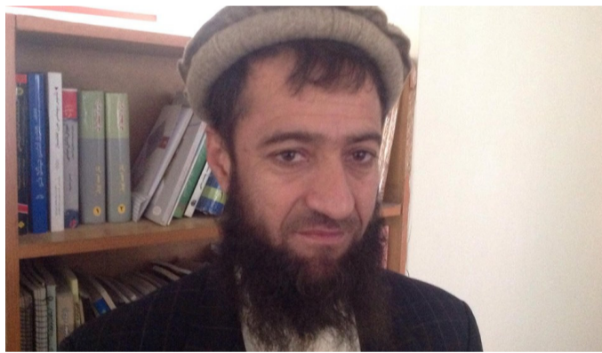
کمیسیون برای مردم توزیع گردیده و حتا مردم توسط همین کارت‌ها رأی داده اند؛ مشکل کاندیدان... ادامه صفحه ۶

بیشتر در انتخابات گذشته توزیع گردیده بود که حال کمپیوتر قادر به خواندن و شناسایی این کارتها نیست. بررسی‌های کمیسیون بررسی شکایات انتخاباتی را چگونه ارزیابی می‌کنید؟ اول این که کمیسیون مستقل انتخابات نظر به گفته رییس پیشین این کمیسیون گفت که ما هفده میلیون کارت رأی‌دهی برای واجدین شرایط توزیع کرده‌ایم که از آن شمار هفت میلیون آن شامل دیتابیس است و ده میلیون دیگر آن در دیتابیس ثبت نگردیده است. وقتی ثبت دیتابیس نشده است و این کارتها از طرف این