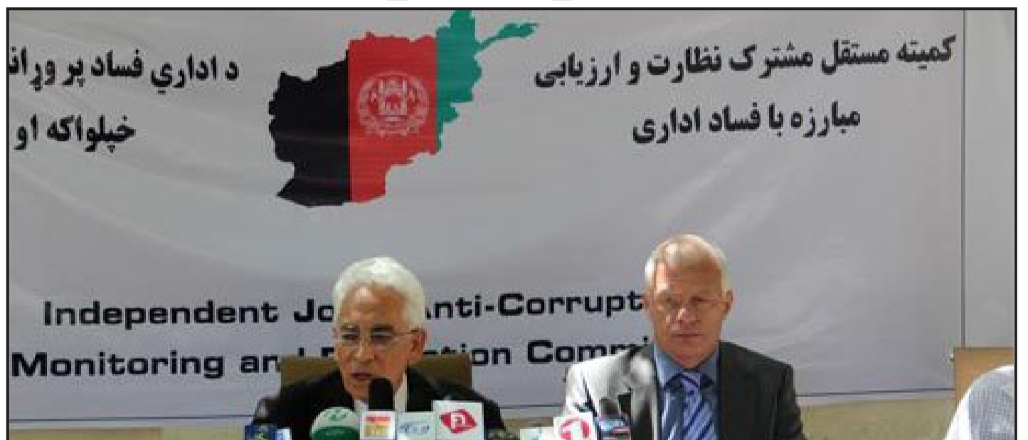
کمیته مستقل مشترک نظارت و ارزیابی مبارزه با فساد اداری