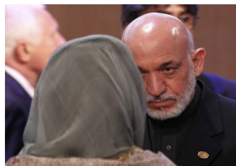
ملی و سیاست خارجی پاکستان به کابل، به نظر می‌رسد حامد کرزی در تصمیم خود تجدید نظر کرده است.

وزارت خارجه اعلام کرد که قرار است رییس‌جمهور کرزی در آینده نزدیک به اسلام‌آباد سفر کند. آقای کرزی پس از آن دعوت مقامات پاکستان را پذیرفت که سرتاج عزیز مشاور امنیت ملی این کشور به کابل سفر کرد.