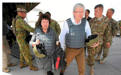
فرا رسیده است.

استرالیا در حال آماده‌سازی برای خروج نیروهایش از افغانستان است.