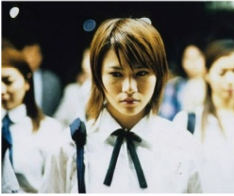
Pulse AKA Kairo

کیوشی کروساوا شاید بهترین کارگردان دهه ۹۰ جاپان باشد و این فیلم ترسناک‌ترین اثر اوست. گروهی از دانشجویان درمی‌یابند که دوستان و هم‌صنفی‌هایشان بر در اتاق خود نوار قرمز می‌چسبانند و سپس خودکشی می‌کنند. ترسناک‌تر