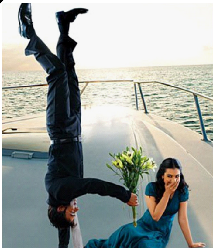
بخش دوم و پایانی